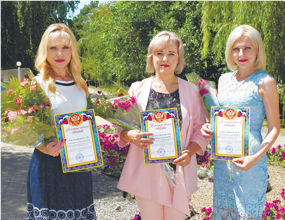
Благодарственные письма главы администрации района специалистам отдела социальной защиты населения в честь праздника.

«День социального работника» – это праздник людей милосердных, бескорыстных, готовых в любую минуту оказать помощь людям, оказавшимся в трудной жизненной ситуации. Поздравления с Днём социального работника каждый год принимают тысячи человек, которые выбрали для себя такую непростую профессию.